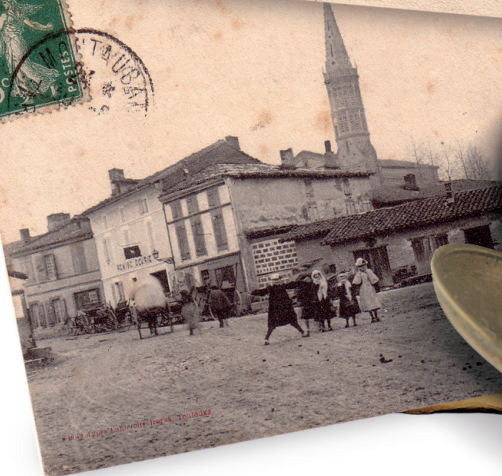
Grisolles — Grande Rue