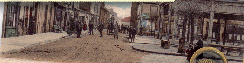
Delmas, Bureau de Tabac, Grisolles