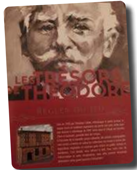
Amicalement, Les Amis du Musée Calbet