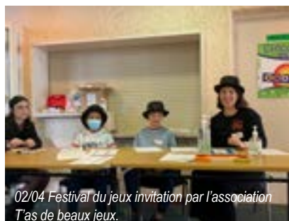
02/04 Festival du jeux invitation par l'association T'as de beaux jeux.