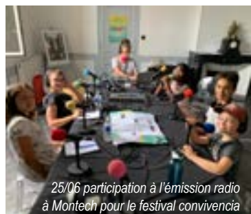
25/06 participation à l'émission radio à Montech pour le festival convivencia