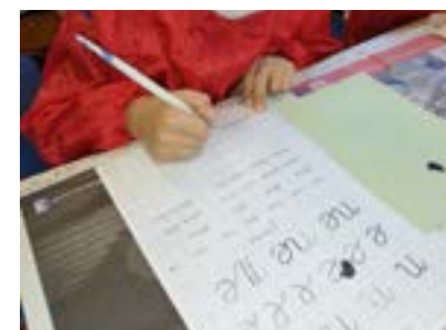
Atelier dans une classe de Grisolles : écrire à la plume comme à l'école d'autrefois

En cette période de fermeture imposée aux publics, l'équipe du Musée Calbet a continué à venir à l'école élémentaire de Grisolles pour garder les liens avec les jeunes Grisollais sur des thématiques liées aux collections : l'enfance et l'école d'autrefois, la préhistoire dans la vallée de la Garonne, l'époque gallo-romaine, le XVIIIe siècle