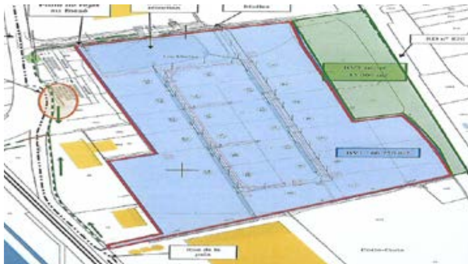
Le Plan de la future zone d'activité

La commercialisation a débuté et, à ce jour, trois entreprises ont donné leur accord pour implanter leurs activités. Nul doute que bien d'autres suivront rapidement, à la grande satisfaction de la municipalité.