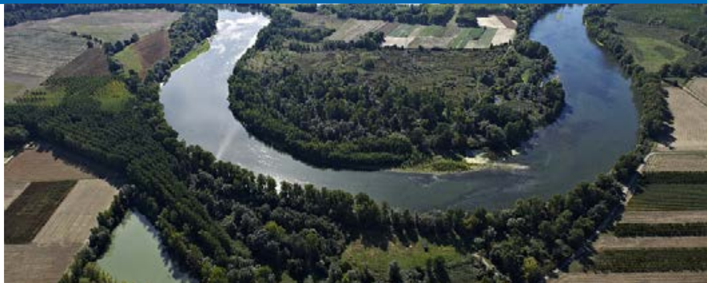
Mauvers-Les Bordes Grisolles