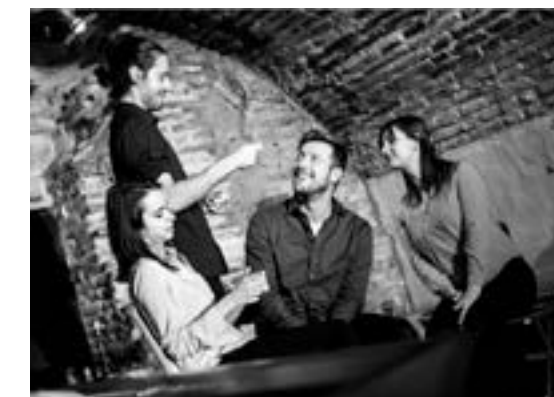
Impro au musée Calbet avec le Grand i Théâtre

sons le respect des mesures sanitaires, vous nous garantissez de passer une bonne soirée ! Gratuit. Ouvert à tous dans la limite des autorisations gouvernementales. Sur inscription à l'adresse contact@museecalbet.com